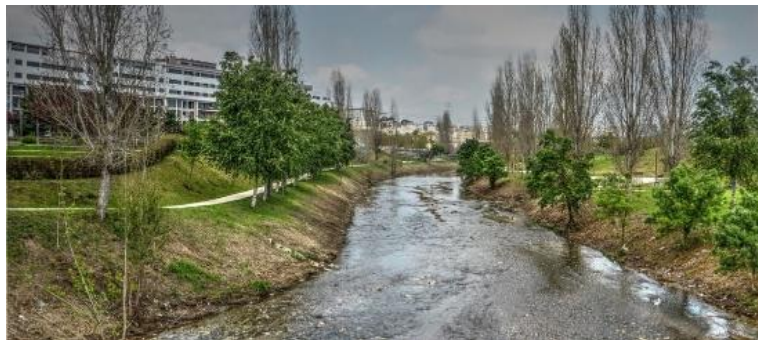
Figura 2: Imagem representativa do Rio da Costa

#CoesãoSocial_Cidadania #Freguesias_todas