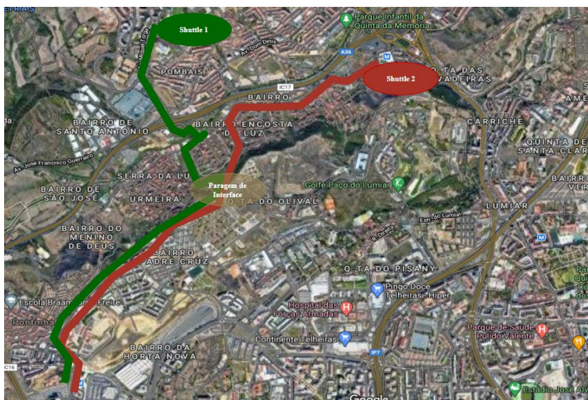
Figura 1: Percursos dos Shuttle - Linha 1 e Linha 2

#Odivelas #PóvoaStoAdrião_OlivalBasto #Pontinha_Famões