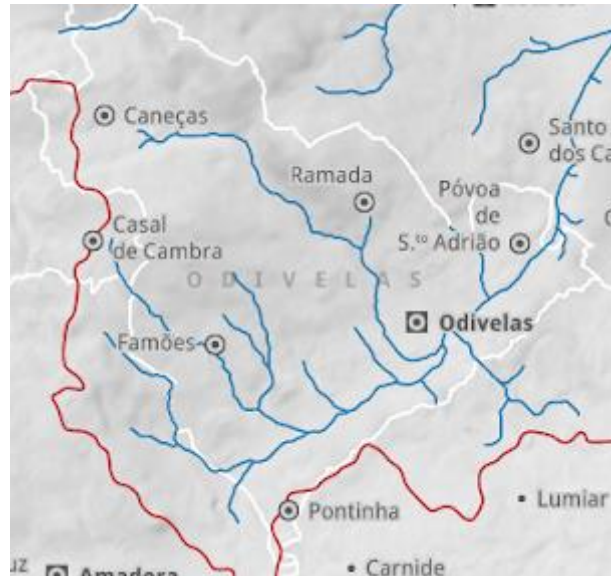
Figura 3: Reabilitação dos Rios e Ribeiras