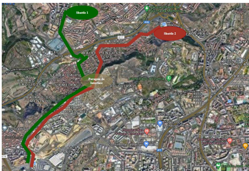
Figura 21: Percursos dos Shuttle – Linha 1 e Linha 2