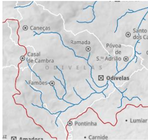
Figura 3: Reabilitação dos Rios e Ribeiras